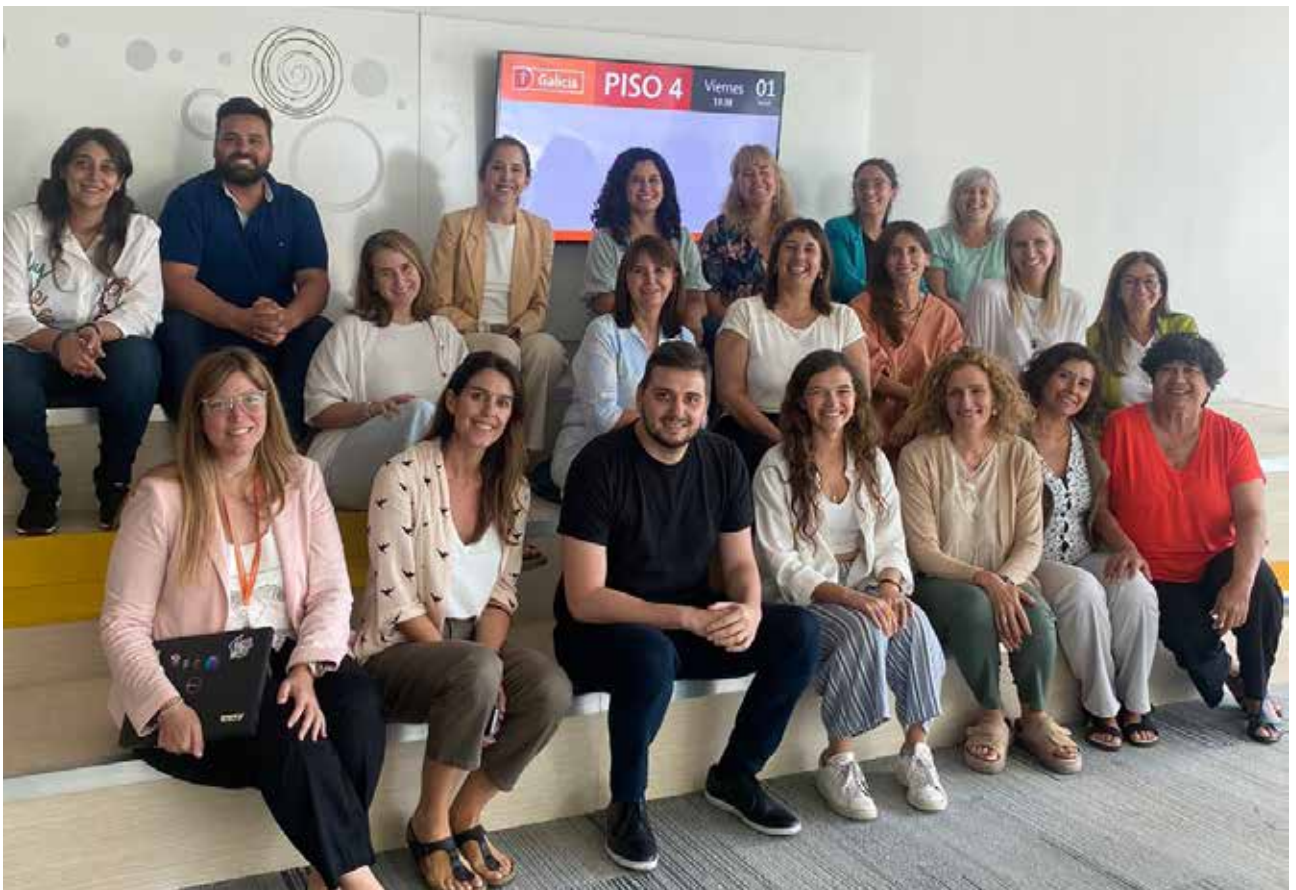
Coordinadores de todas las organizaciones del país junto a autoridades del Banco Galicia en el encuentro de apertura 2024 del programa Potenciamos tu Talento.