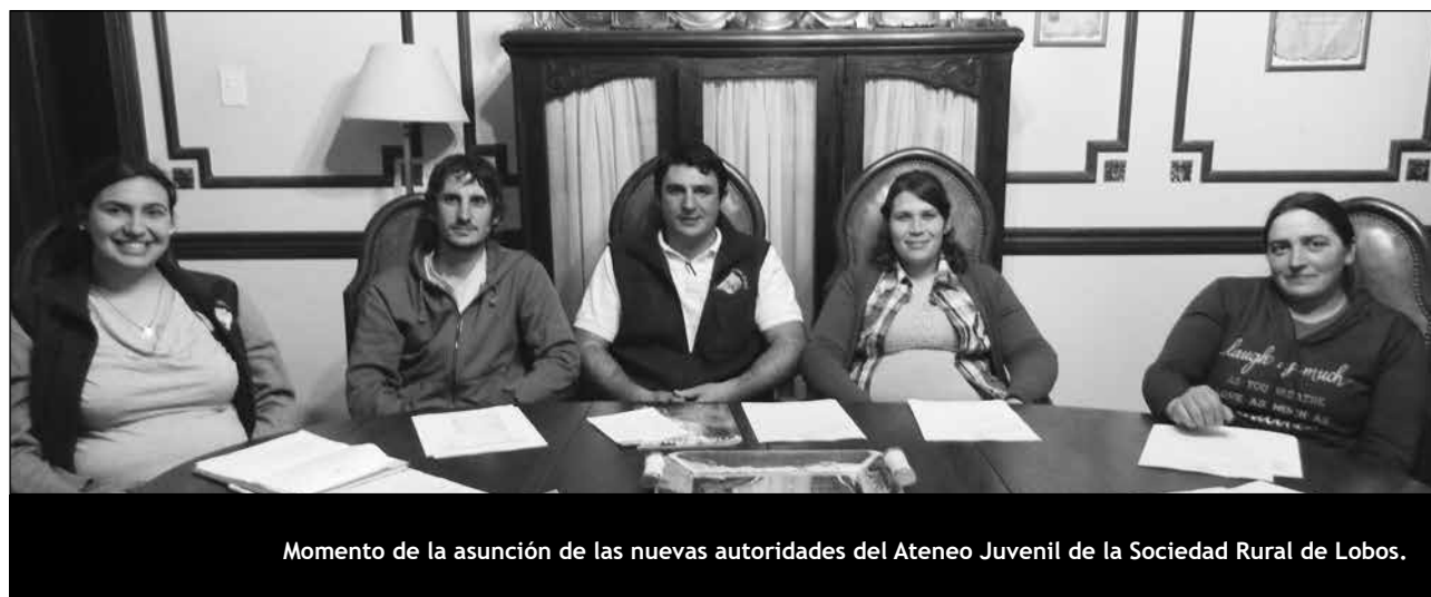
Momento de la asunción de las nuevas autoridades del Ateneo Juvenil de la Sociedad Rural de Lobos.

LC — En una charla en el Consejo Directivo de Carpap tocaron ese tema, es decir, que hay gente